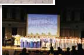
文化フェスティバル