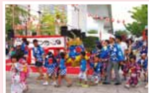
サマー イブニング カーニバル