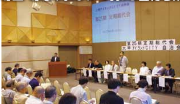
▲昨年の総代会の様子

今年の総代会は、6月10日(日)にリバーモール西側のインターセンター3階バンケットホールで午後1時から開催されます。会議に先立ち、この六甲アイランドだより(自治会報)で議案書の内容を住民の皆様にご公表します。推薦もしくは立候補で総代になられた方は総代会当日のご出席もしくは委任状のご提出をよろしくお願ひいたします。