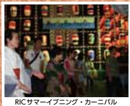
RICサマーイブニング・カーニバル