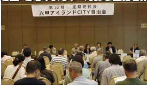
▲昨年の総代会の様子

今年の総代会は、6月14日(日)にリバーモール西側のインターセンター3階バンケットホールで午後1時から開催されます。会議に先立ち、この六甲アイランドだより(自治会報)で議案書の内容を住民の皆さまに公表します。推薦もしくは立候補で総代になられた方は総代会当日のご出席もしくは委任状のご提出をよろしくお願ひいたします。