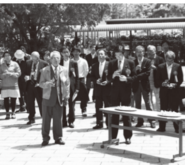
▲昨年のバラ祭りのようす

自治会を担う若い世代層を形成する目的で3年前に創設し、これまでスポーツGOMI拾いや夏祭りにおけるイベントなど青年部単独の活動を行ってきまし。しかし、部の中心的役割を果たす人材は40歳未満という年齢制限を設けたこともあり、専門部会としての単独の運営、継続は困難な状況にあることから、残念ながら今年度は休部せざるを得ません。