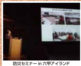
防災セミナー in 六甲アイランド