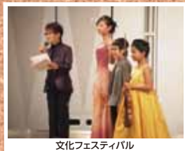
文化フェスティバル