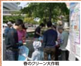
春のクリーン大作戦