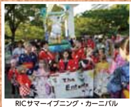
RICサマーイブニング・カーニバル