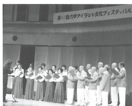
▲昨年の文化フェスティバルから

尚、「スポーツGOMI拾いIN六甲アイランド」は、秋に開催を予定しています。またフォト・コンテストの作品募集は、10月より開始します。