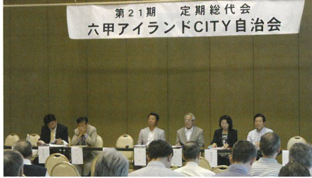
▲昨年の総代会の様子

今年の総代会は、6月8日(日)にリーパーモール西側のインターセンター3階バンケットホールで午後1時から開催されます。会議に先立ち、この六甲アイランドだより(自治会報)で議案書の内容を住民の皆様にご公表します。推薦もしくは立候補で総代になられた方は総代会当日の出席もしくは委任状のご提出をよろしくお願い致します。