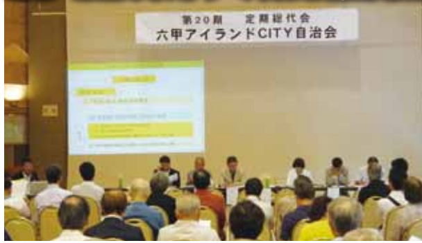
▲昨年の総代会の様子

今年の総代会は、6月9日(日)にリーバーモール西側のインターセンター3階バンケットホールで午後1時から開催されます。会議に先立ち、この六甲アイランドだより(自治会報)で議案書の内容を住民の皆様にご発表します。推薦もしくは立候補で総代になられた方は総代会当日のご出席もしくは委任状のご提出をよろしくお願いたします。