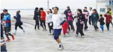
▲今年1月に行われた「震災メモリアル ウォーク&ラン」の様子

地域振興会と協働して「街の誕生25周年へ向けた活性化事業」への積極的参画と支援を行って参りました。今期の新たな地域活動として、島内のスポーツ関連の諸団体が協働して昨年11月に島内初の「スポーツエキスポ」が開催されました。今後も継続して住民の健康増進に役立つ事業として自治会としても積極的に参加致します。