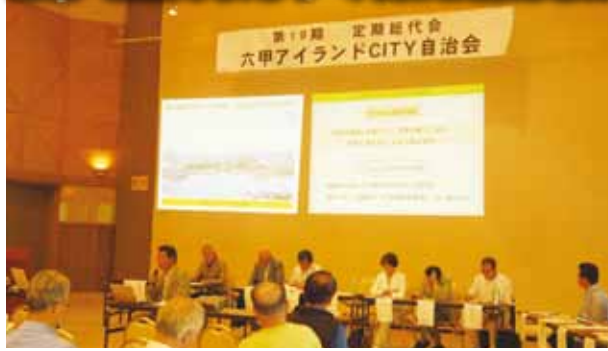
▲昨年の総代会の様子

今年の総代会は、6月10日(日)にリバーモール西側のインターセンター3階バンケットホールで午後1時から開催されます。会議に先立ち、この六甲アイランドだより(自治会報)で議案書の内容を住民の皆様様に公開します。推薦もしくは立候補で総代になられた方は、総代会当日のご出席もしくは委任状のご提出を宜しくお願いたします。