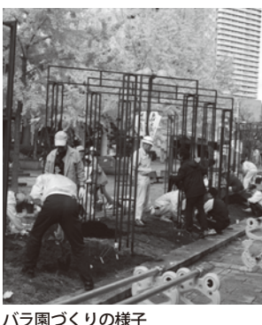
バラ園づくりの様子